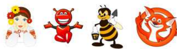
С персонажем (главным героем)